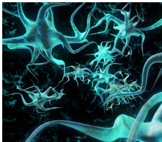
Figura 3: Sinapsis o contacto entre neuronas

Fuente: geekets.com Consultado: 09 de noviembre de 2010